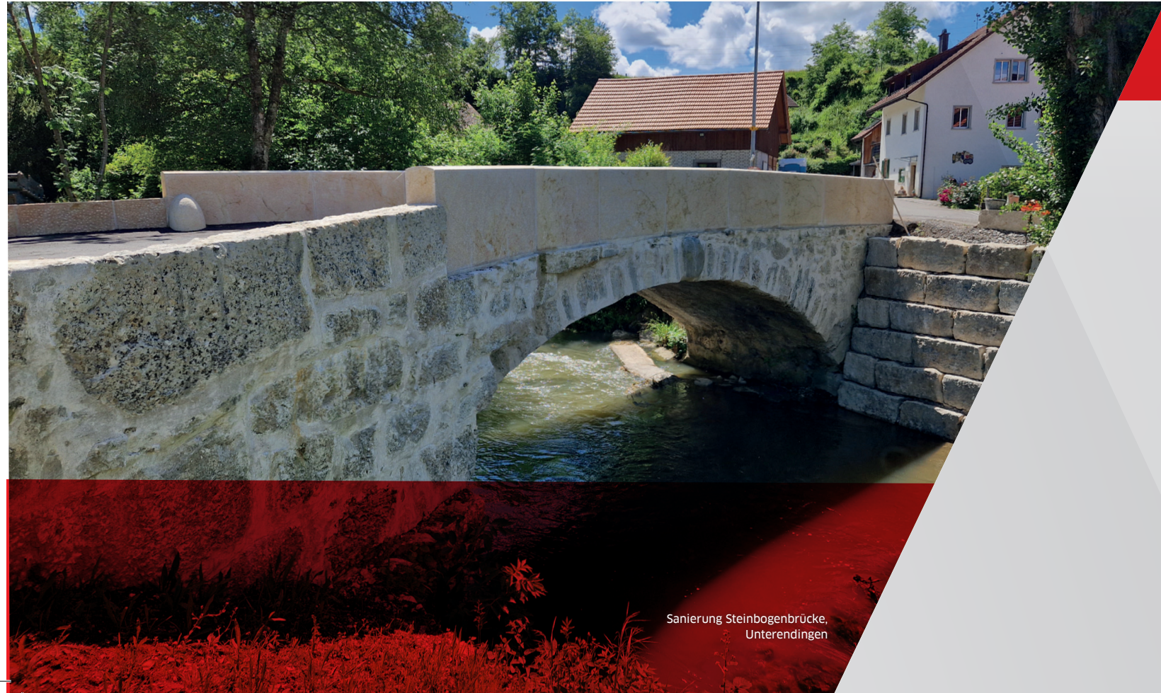
Sanierung Steinbogenbrücke, Unterendingen