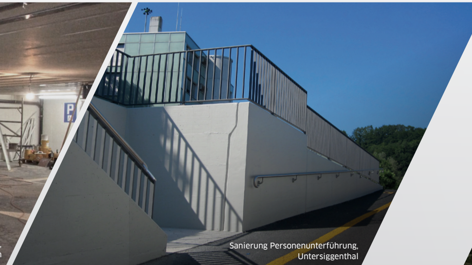
Sanierung Personenunterführung, Untersiggenthal