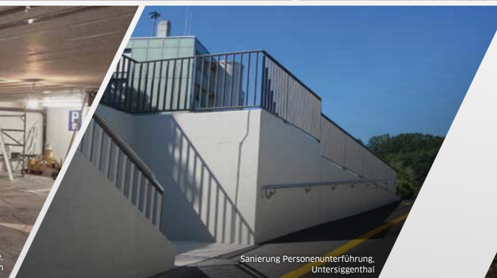
Sanierung Personenunterführung, Untersiggenthal