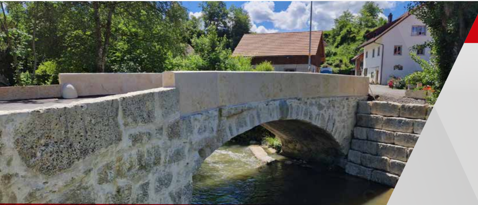
Sanierung Steinbogenbrücke, Unterendingen